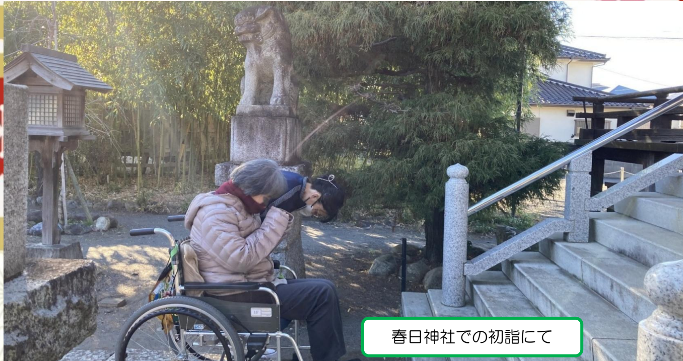
春日神社での初詣にて